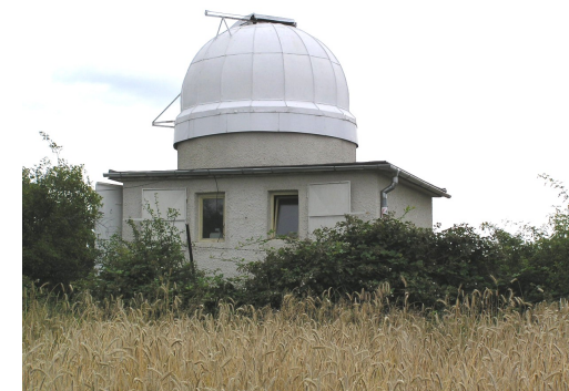
Pozorovatelna UP v Olomouci-Lošově