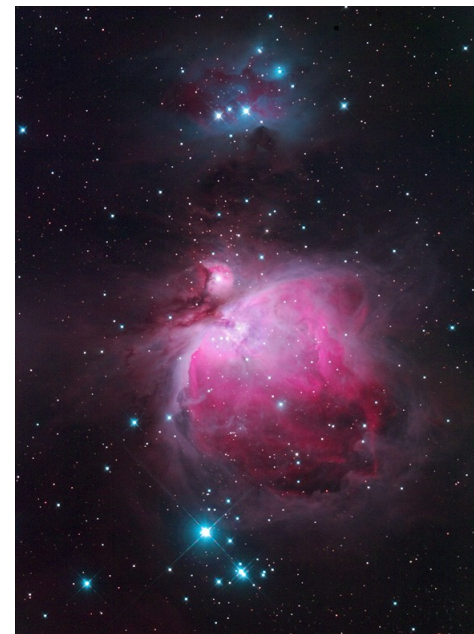
Mlhovina v souhvězdí Orionu, nazývaná „Velká“ (M 42). Je od nás vzdálená asi 1 500 světelných let.

články v regionálním tisku (Olomoucký deník) zajištění prohlídky hvězdárny v rámci cyklu vycházek „Drobné památky Olomouce“