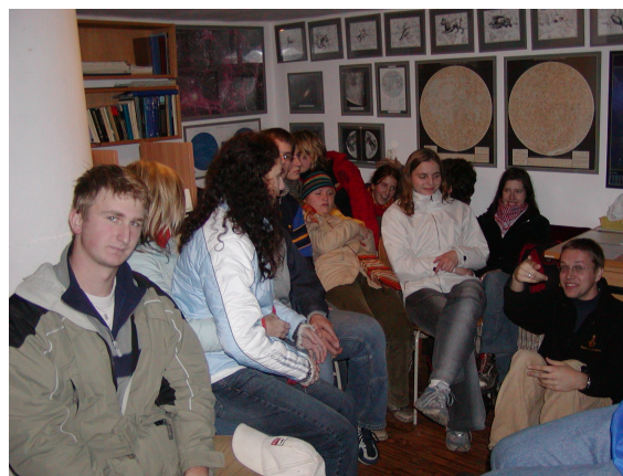
Návštěvníci hvězdárny čekají na zahájení pořadu.